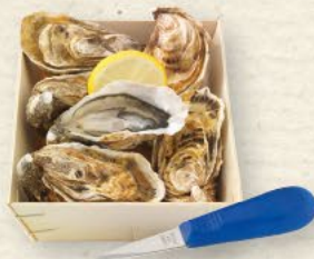
Austern Fines de Claire 6 delikate Fines-de-Claire-Austern, mit passendem Austermesser, Box