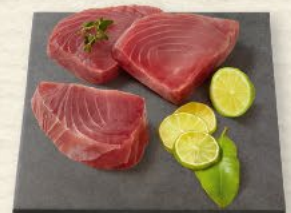
Thunfisch-Steaks das beste Stück vom Thunfisch, ideal zum Grillen und Braten, 100 g