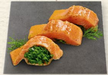
Lachsfilets Kräuterbouquet frisches Lachsfilet in feiner Marinade mit typischen Gartenkräutern und Knoblauch, 100 g