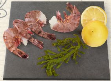
Riesengarnelenschwänze Black-Tiger-Garnelen (Seawater) roh, ohne Kopf, entdarmt, zum Verkauf aufgetaut, aromatisches Fleisch für die vielseitige Verwendung in der Küche, 100 g