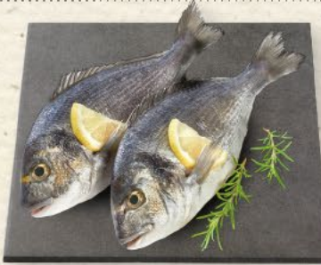
Dorade Royal aus Aquakultur, festes, mageres Fleisch, ideal zum Dünsten, Braten und Grillen, 100 g