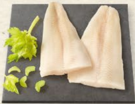
MSC Schwarze Heilbuttfillets ohne Haut, zartes, weißes Fleisch für Genießer, zum Verzehr aufgetaut, 100 g