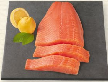
Lachsfilet mit Haut aus Aquakultur