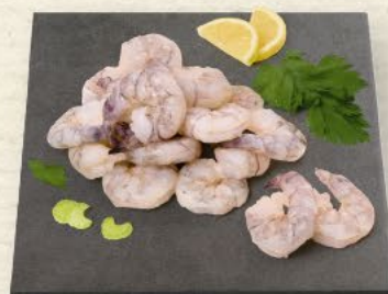
Riesengarnelenschwänze 13/15 Seawater Garnelen roh, ohne Kopf und ohne Schale, zum Verkauf aufgetaut, 100 g