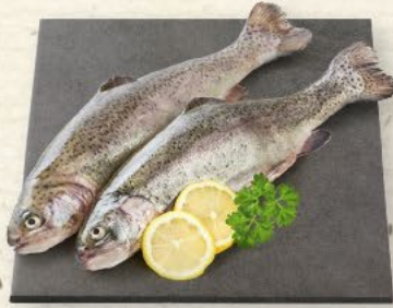
Regenbogenforellen ausgenommen, küchenfertig, aus Aquakultur