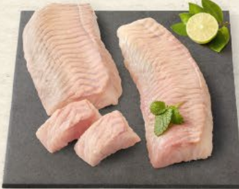
Seelachsrückfilets das beste Stück des Seelachs, festes, weißes Fleisch, 100 g