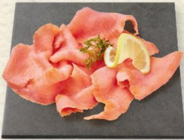
Räucherlachs geschnitten typisches Raucharoma, 100 g