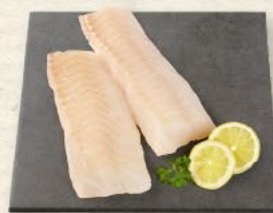
MSC Kabeljaurückfilets ohne Haut, das beste Stück des Kabeljau, zartes, festes Fleisch mit dezenter Salznote und einem sehr geringen Fettgehalt, 100 g