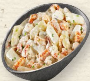
Flusskrebs-Spargelsalat Louisiana-Flusskrebsschwänze im Zusammenspiel mit zartem Spargel und fruchtig-süßer Mango, in einem cremigen Dressing mit Sahne und Frischkäse