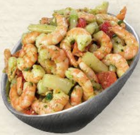
Garnelen-Spargel-Salat knackig-zarte Garnelen und feiner Spargel, raffiniert abgeschmeckt mit Bärlauchpesto, Lauchzwiebeln und Pinienkernen, 100 g