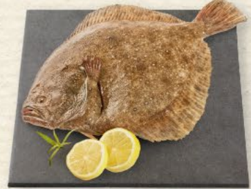
Steinbutt aus Aquakultur, ideal zum Grillen und Braten, 100 g