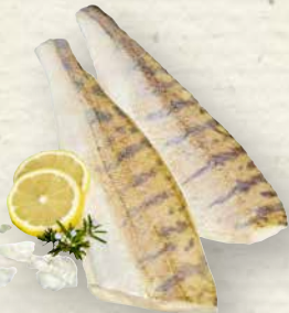
Zanderfilet mit Haut, festes, zartes Fleisch mit angenehm dezentem Geschmack, zum Verkauf aufgetaut