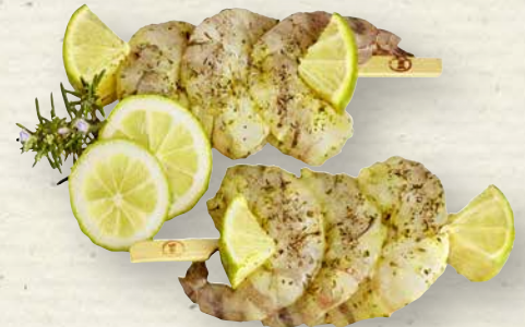
Garnelenspieß mariniert in Kräutermarinade und Limettenstücken