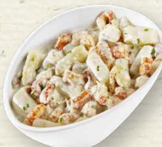
Flusskrebs-Spargelsalat Louisiana-Flusskrebsschwänze im Zusammenspiel mit zartem Spargel und fruchtig-süßer Mango, in einem cremigen Dressing mit Sahne und Frischkäse