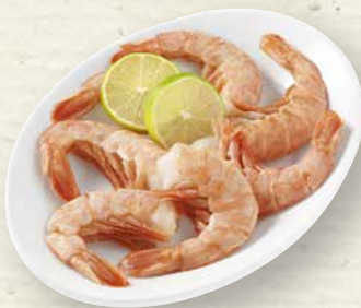
Argentinische Rotgarnelen Wildfang, roh, ohne Kopf, mit Schwanzsegment, zum Verzehr aufgetaut