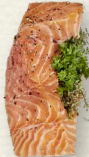
Lachsfilet „Kräuterbouquet“ frisches Lachsfilet in feiner Marinade mit typischen Gartenkräutern und Knoblauch