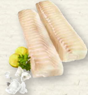
Kabeljaurückenfilet ohne Haut, das beste Stück des Kabeljau, zartes, festes Fleisch mit dezenter Salznote und einem sehr geringen Fettgehalt