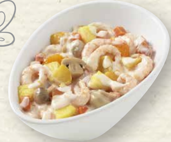
Fruchtiger Shrimps-Cocktail Miami Shrimps mit Ananas, Pfirsichen, Papayas und Champignons, in fein gewürzter Mayonnaise