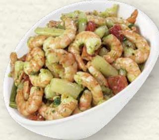
Garnelen-Spargel-Salat knackig-zarte Garnelen und feiner Spargel, raffiniert abgeschmeckt mit Bärlauchpesto, Lauchzwiebeln und Pinienkernen