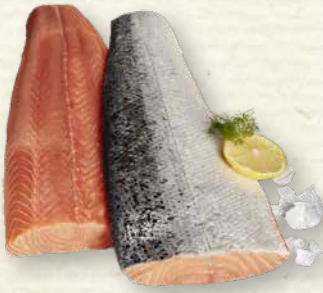
Lachsfilet mit Haut aus Aquakultur