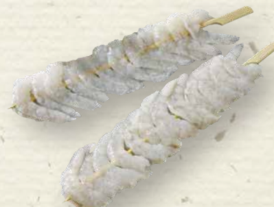
Garnelenspieß zum Verkauf aufgetaut, der ideale Begleiter zum Salat, zum Grillen geeignet