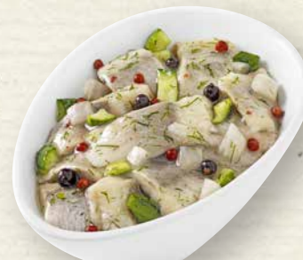
Dillhappen friesische Art Heringshappen mit Zwiebeln, Gurken, roten und schwarzen Wacholderbeeren in klarem Dressing