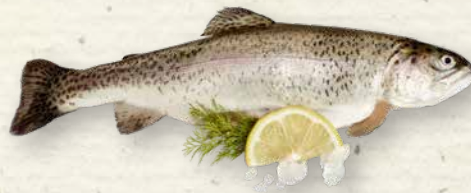
Regenbogenforellen ausgenommen, küchenfertig, aus Aquakultur